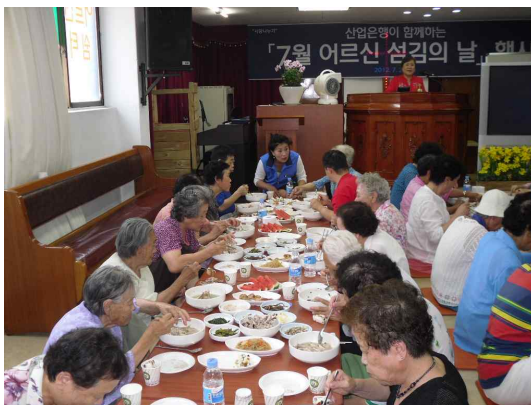
어르신 쉼터 무료급식 봉사

산업은행 임직원과 임원부인회, 서울시 새마을부녀회 등이 공동으로 2008년부터 김장을 하고 있습니다. 김장김치는 서울시내 독거노인, 소년소녀가장, 빈곤가정과 사회복지시설 등 어려운 이웃들의 따뜻한 겨울나기를 지원하는 ‘사랑의 김장나누기’ 행사를 통해 전달되었습니다. 올해도 1만 포기를 담가 25개 구의 소외계층 800세대, 사회복지시설 20개소, 영등포구 독거노인 200세대 등에 전달하였습니다. 김장나누기 행사는 해마다 배추와 고춧가루 등 농산물 가격이 많이 올라 월동준비를 하기 어려운 이웃에게 작은 정성을 전할 수 있어서 위안이 되는 행사였습니다. 앞으로도 KDB산업은행은 따뜻한 나눔의 실천에 앞장설 예정입니다.