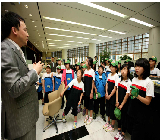
도서벽지 어린이 서울초청

KDB산업은행은 임직원들의 급여에서 일정부분을 모은 기부금과 은행의 지원금 등을 재원으로 형편이 어려운 학생들을 돕는 KDB장학사업을 실시하고 있습니다. 이를 통하여 현재 210명의 초, 중, 고 학생들에게 매월 학자금 및 생활보조금을 지원하여 저소득 계층 학생들의 학업 성장을 도도 하고, 미래의 인재로 성장할 수 있도록 돕고 있습니다. 또한 2001년부터 매년 도서벽지 어린이 서울초청 행사와 청소년 경제교육 자원봉사(JA Korea) 등을 통하여 장래 대한민국을 이끌어 갈 꿈 나무들에게 희망과 비전을 심어주려 노력하고 있습니다.