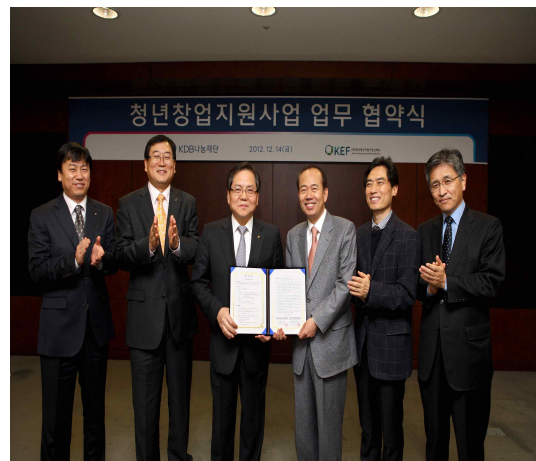
청년창업지원사업 업무 협약식