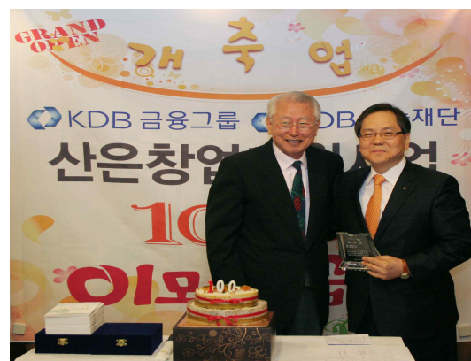
KDB창업지원기금 100호점 개업기념