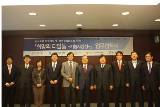
희망의디딤돌 업무 협약식

KDB 산업은행은 저소득층의 노동시장 진입을 지원하여 개인의 자립과 일자리 창출을 도모하고 중소기업 인력난을 해소하기 위하여 KDB나눔재단을 통해 '희망의 디딤돌-기능사 양성사업'을 진행하고 있습니다. 청년가장 및 실직가장을 우선 선발하여 일정 기간 자동차, 도장, 전기제어 분야 교육 등 고용 연계형 취업교육을 지원하고, 교육생을 채용한 중소기업에 1년간 인건비를 보조해주는 고용 연계형 자립지원 프로그램으로서 2012년까지 26억원 규모의 지원을 하고 총 165명의 기능사를 양성하였습니다. 앞으로도 KDB 산업은행은 희망의 디딤돌사업을 통하여 어려운 이웃들의 자립지원을 지속적으로 추진할 것입니다.