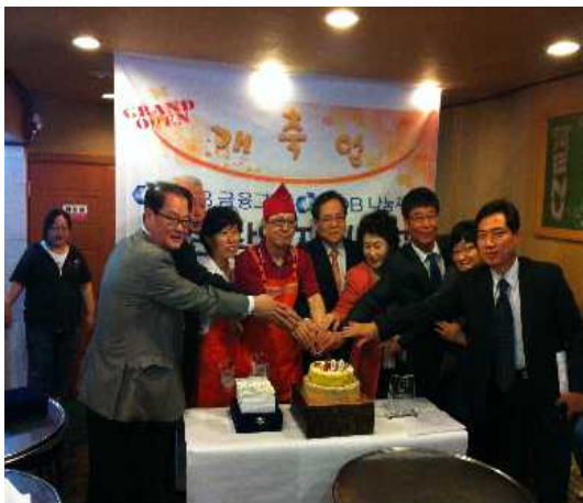
마이크로 크레딧 관련 개업 사진

2012년 KDB산업은행은 마이크로크레딧 사업지원 용도 등으로 미소금융중앙재단 및 신용회복위원회에 35억원을 기부하였습니다. 이 금액은 저소득층 서민과 개인신용불량자의 자립을 위해 기부된 것입니다. 또한, KDB나눔재단에서는 청년창업지원, 퇴직자창업지원, 소외계층창업지원, 전통공예산업지원, 인재양성사업, 장학사업, 취약계층 자립지원사업(희망의 디딤돌, KDB 창업지원기금, 북한이탈주민시설 지원) 등을 활발하게 실시하여 사회적 책무를 수행하고 있습니다.